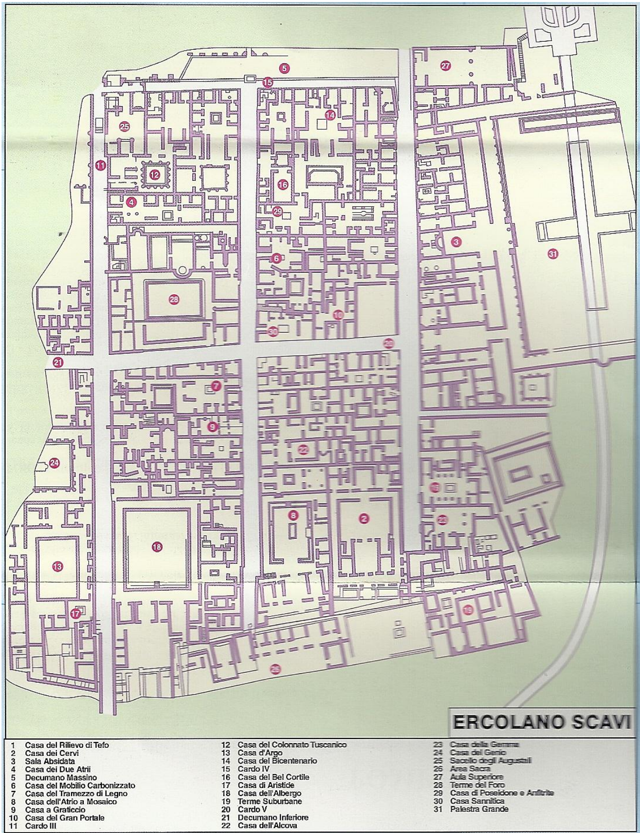
Abbildung 7: Plan der Ausgrabungen von Herculaneum