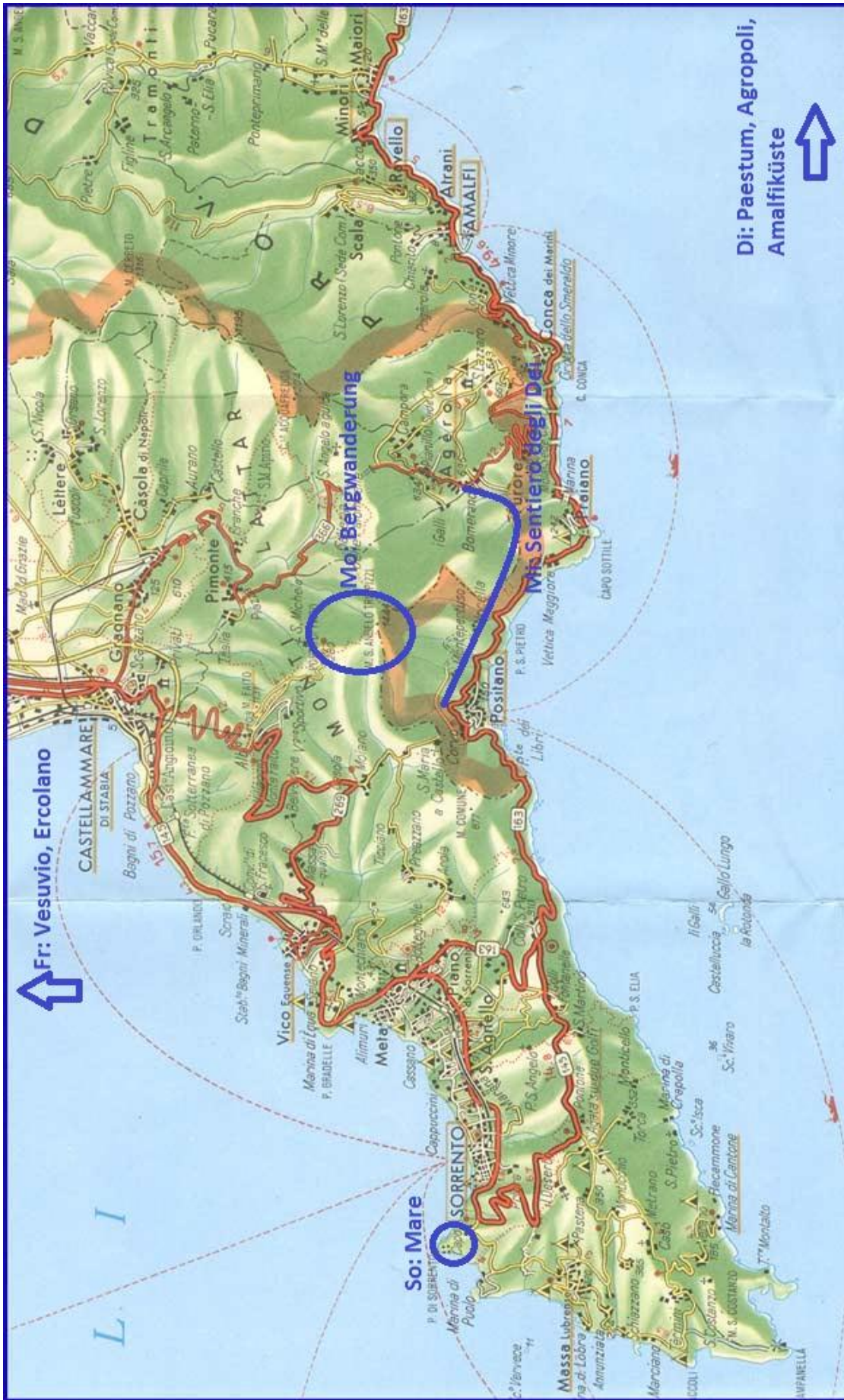
Abbildung 1: Übersichtskarte der sorrentinischen Küste mit den wichtigsten Programmpunkten