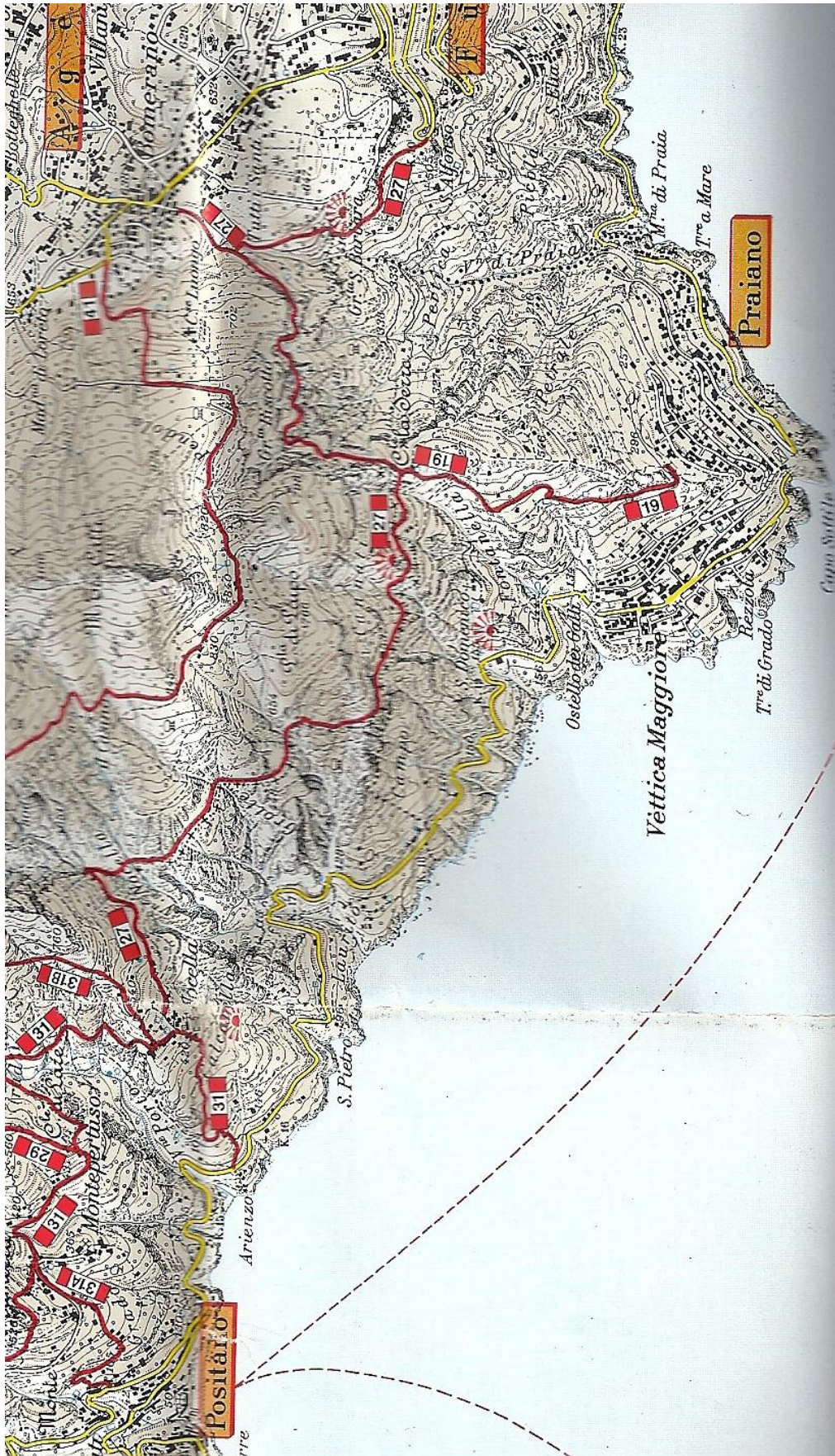
Abbildung 6: Der Sentiero degli Dei (Nr. 27/31) startet in Bomerano und endet für uns in Montepertusco (Bus nach Positano)