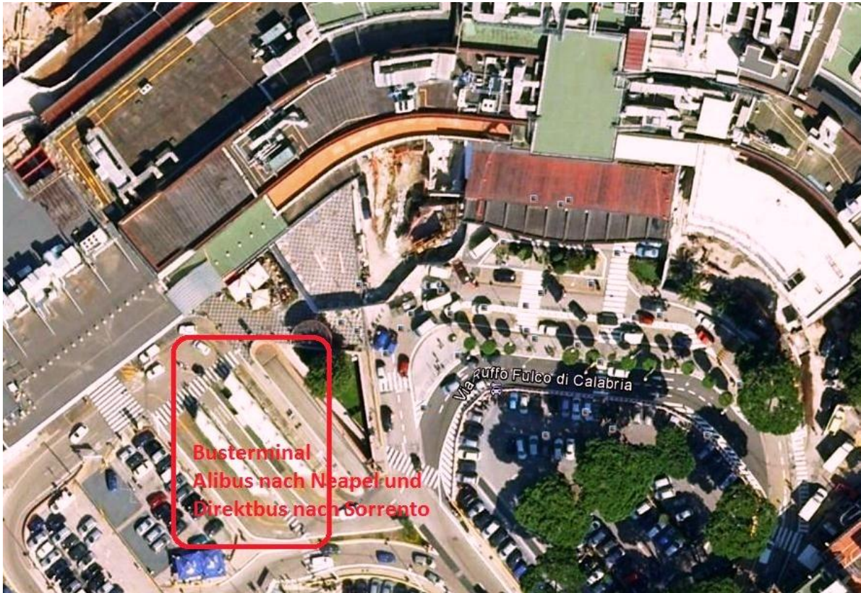
Abbildung 2: Flughafen Capodichino Napoli und Busterminal

9:00 / 10:00 / 11:00 / 12:00 / 13:00 / 14:30 / 15:30