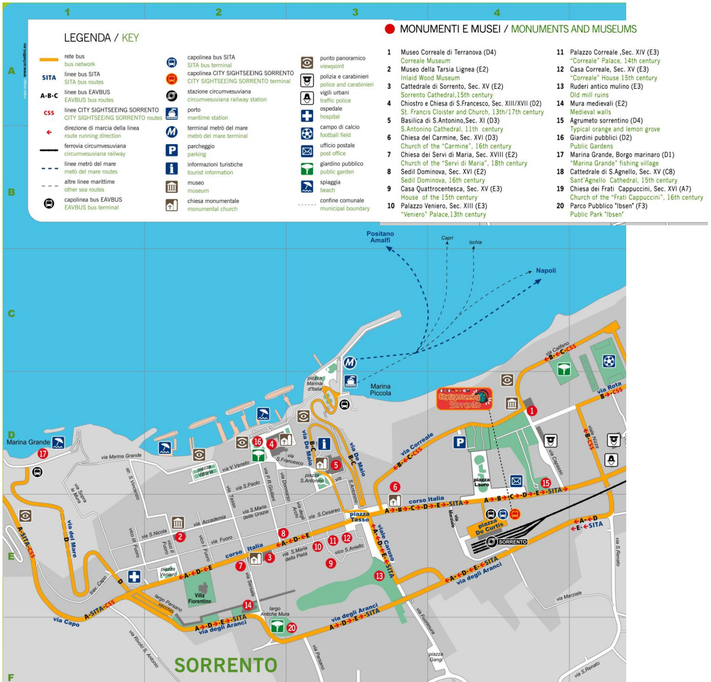
Abbildung 4: Ortsplan von Sorrento mit Buslinien und Sehenswürdigkeiten

Wir werden uns noch über die Öffnungszeiten erkundigen.